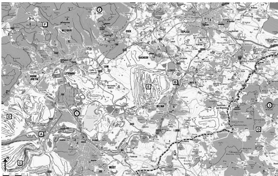
Obr. 1. Mapa. 1 – observatoř Kopisty, 2 – observatoř Dlouhá louka, 3 – observatoř Milešovka, A – elektrárna Komořany, B – elektrárna Ledvice, C, D, E – povrchové uhelné doly, F – Krušné hory, G – České středohoří

Observatoř umožňuje umístění odběrového zařízení ve výšce 20 m. Obdobně jako u výše jmenovaných observatoří byly odběry prováděny také v přízemní výškové hladině 1 m.